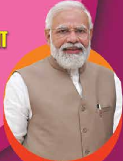
नरेन्द्र मोदी, प्रधानमंत्री