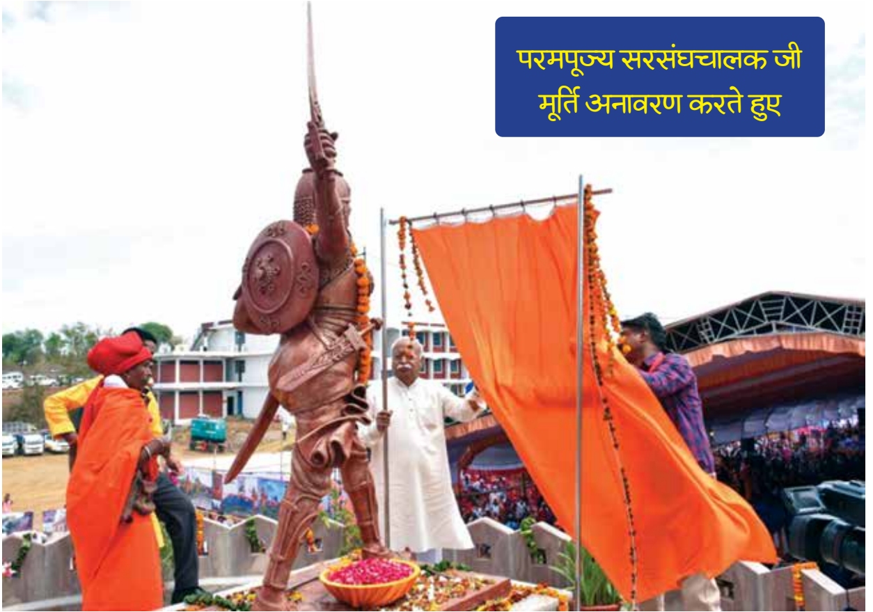
परमपूज्य सरसंघचालक जी मूर्ति अनावरण करते हुए

ग्रामीण क्षेत्र की विरासत एवं परंपरा पर वनवासी बालिकाओं द्वारा सांस्कृतिक कार्यक्रम का प्रस्तुतीकरण