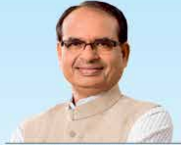
शिवराज सिंह चौहान, मुख्यमंत्री